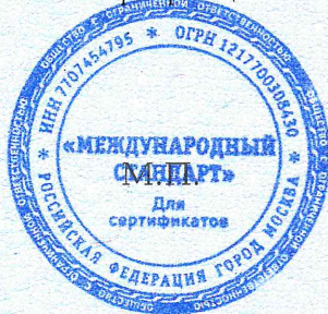
Схема сертификации: 3с.